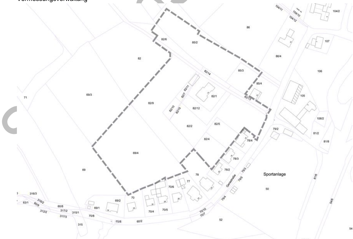
Lageplan mit Abgrenzung des Geltungsbereiches (grau) unmaßstäblich