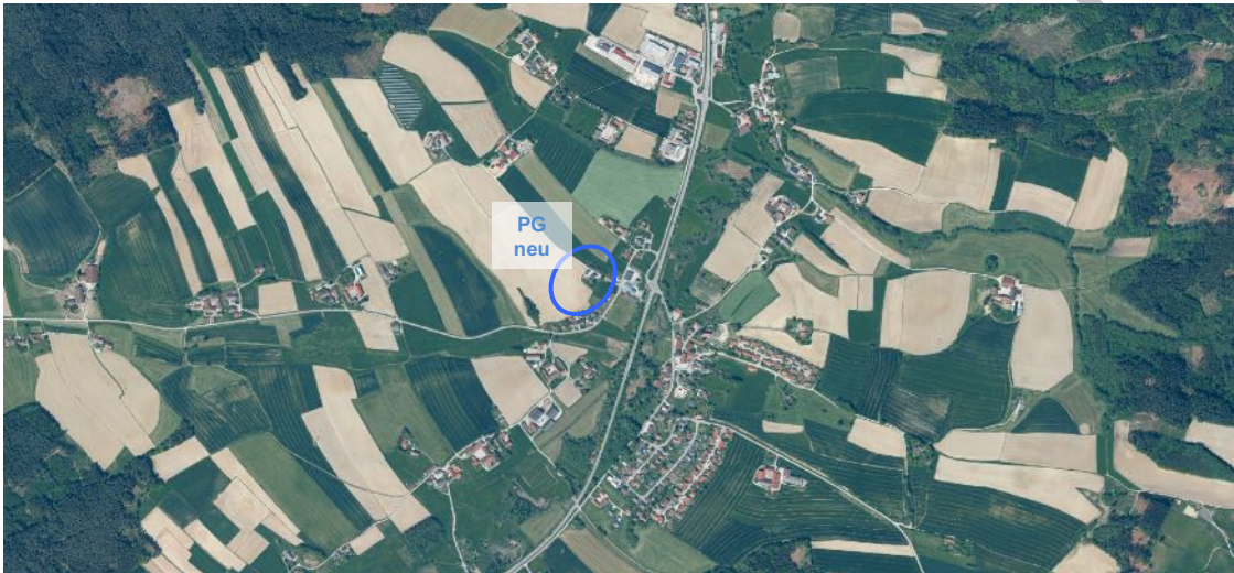
Luftbildausschnitt von Hirschhorn aus FIS-Natur Online des LfU, Geobasisdaten: © Bayerische Vermessungsverwaltung